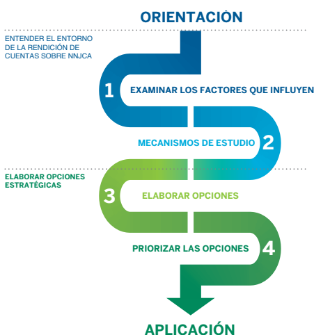
Figura 2: Orientaciones para elaborar enfoques estratégicos para la rendición de cuentas sobre NNJCA

Orientaciones para elaborar enfoques estratégicos para la rendición de cuentas sobre NNJCA : Las orientaciones prácticas, establecidas a partir de la definición y estructura, proporcionan una base para determinar las oportunidades y dificultades relacionadas con la rendición de cuentas sobre NNJCA y elaborar y priorizar las diferentes opciones para su aplicación. Para ello se recurre a ejemplos de casos prácticos de nueve situaciones de conflicto armado para ilustrar la metodología, que se presenta en dos partes :